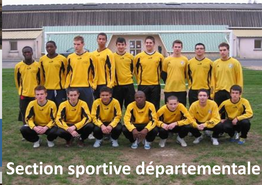
Section sportive départementale