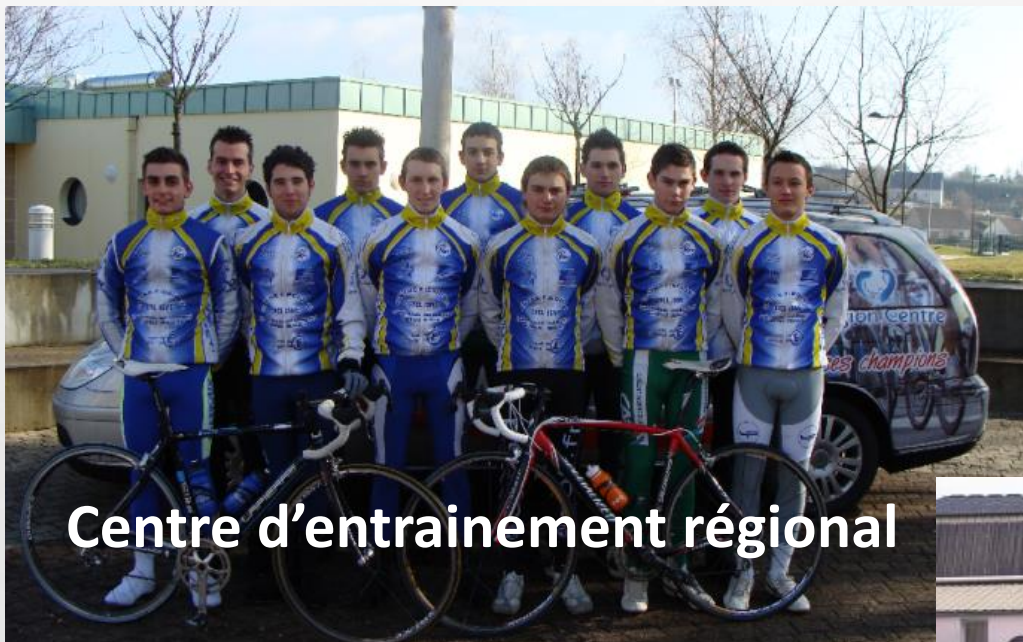
Centre d'entraînement régional